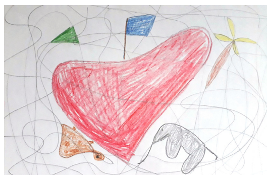
Рис. 4. Работа в технике «Грифонаж»

но предложить включить и выключить подсветку планшета несколько раз, повернуть его, что им очень нравится выполнять.