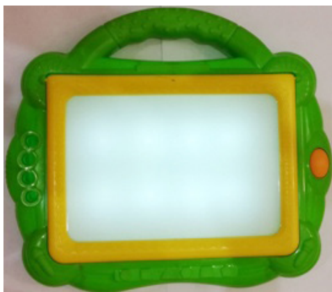
Рис. 1. Планшет для рисования и копирования

В коррекционно-логопедической работе мы используем обычный световой планшет для рисования и копирования (см. рисунок 1).